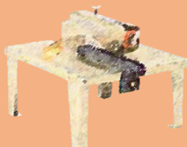
丸のこベンチスタンド